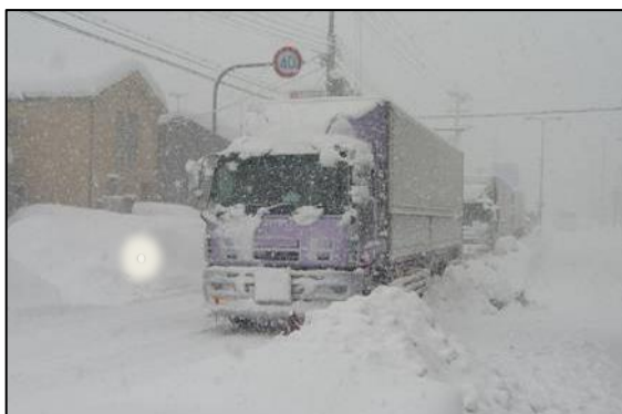
立ち往生車両による渋滞