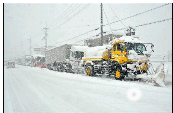
除雪トラックでの牽引による立ち往生車両の移動