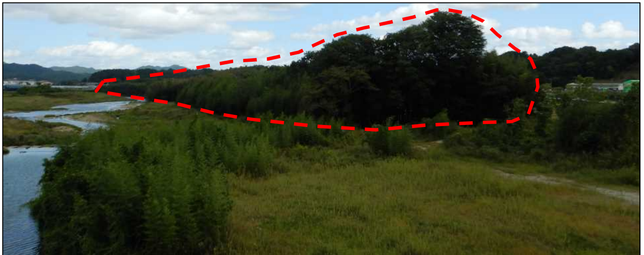
伐採箇所：福知山市猪崎地区