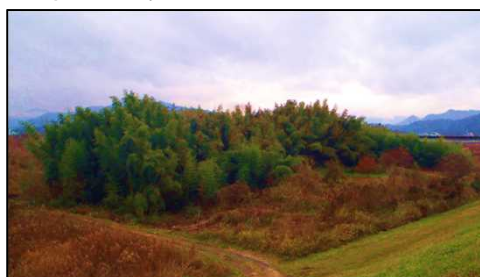
福知山市 中地区 約37,000㎡