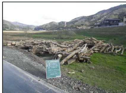
(搬出公募箇所の集積状況)