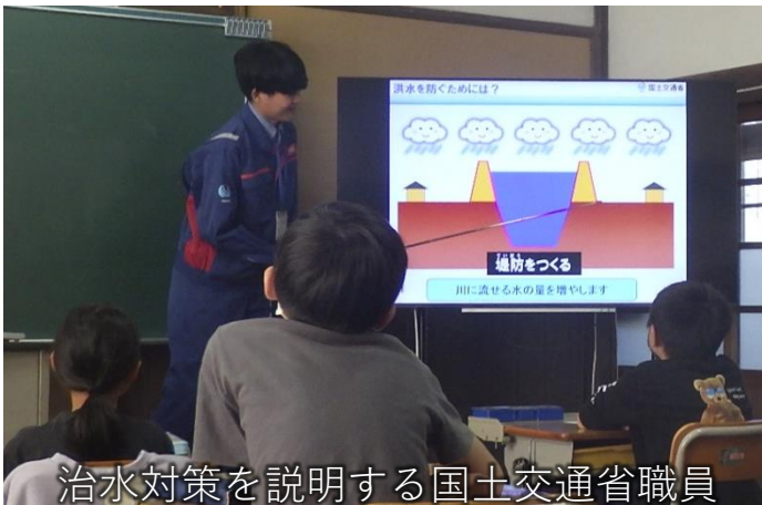
治水対策を説明する国土交通省職員