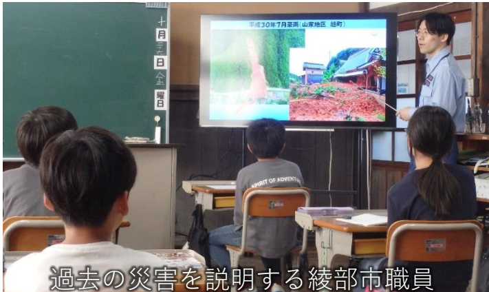
過去の災害を説明する綾部市職員