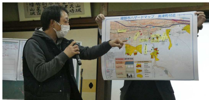
マイ防災マップについての発表の様子