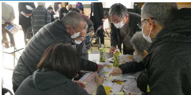
避難経路上の危険箇所についての話し合いの様子