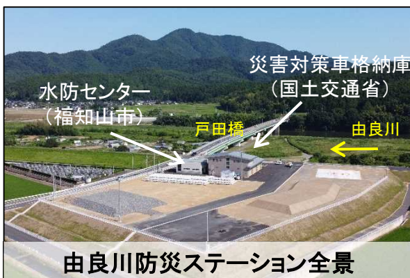
由良川防災ステーション全景