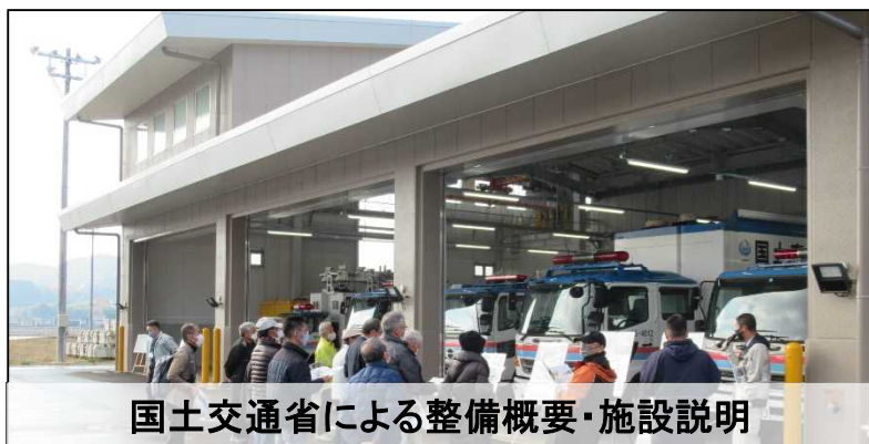
国土交通省による整備概要・施設説明