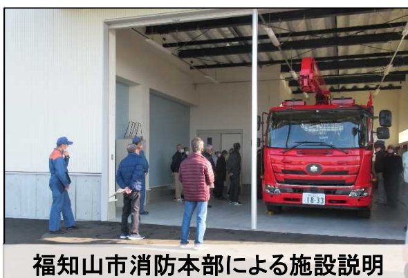
福知山市消防本部による施設説明