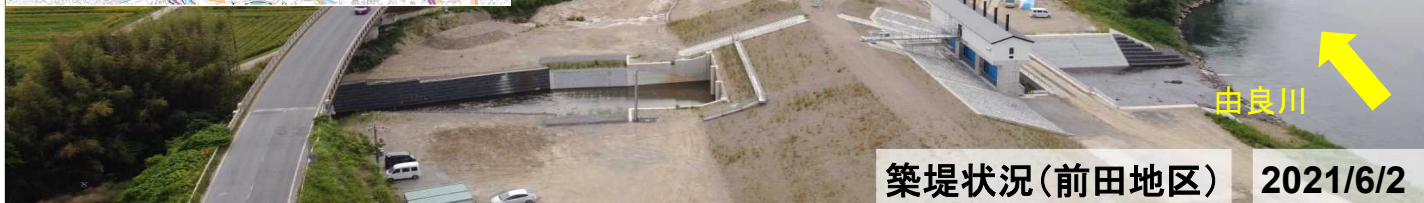
築堤状況(前田地区) 2021/6/2

福知山河川国道事務所では、i-Construction・BIM/CIMの活用を推進しながら、事業の完了に向け引き続き取り組んでまいります。