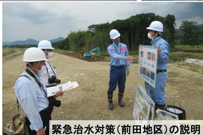
緊急治水対策(前田地区)の説明