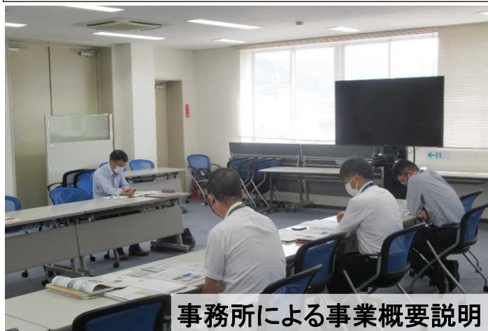
事務所による事業概要説明