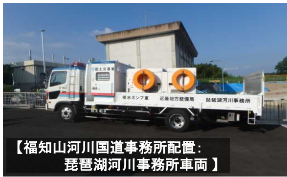
【福知山河川国道事務所配置： 琵琶湖河川事務所車両】