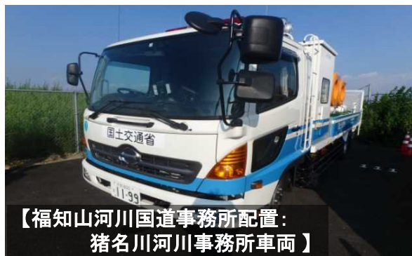
【福知山河川国道事務所配置： 猪名川河川事務所車両】