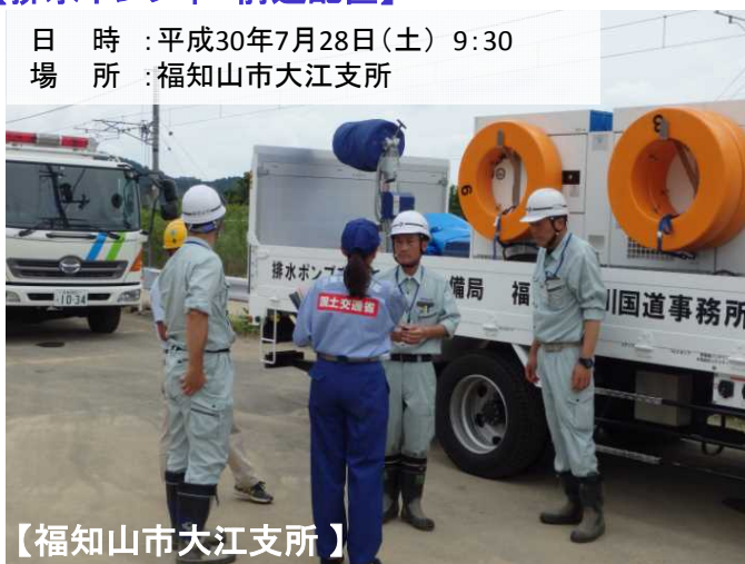
【福知山市大江支所】