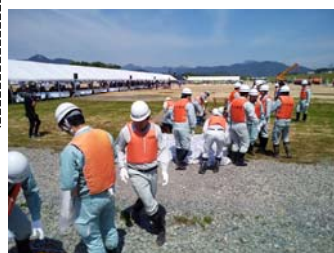
京都府水防班 (積土のう工)