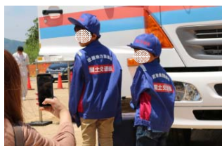
展示コーナー TEC-FORCE隊員体験