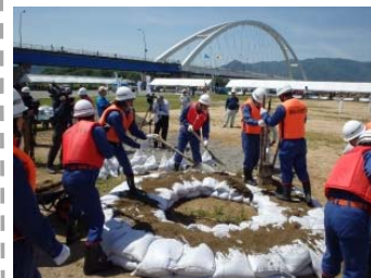
福知山市消防団 (釜段工)