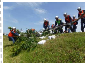
綾部市消防団 (木流し工)