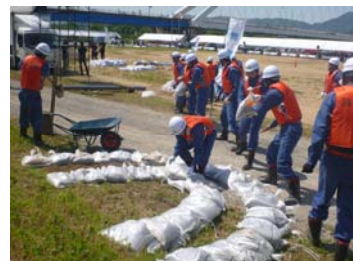
舞鶴市消防団 (月の輪工)