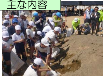
水防活動体験 (福知山公立大学と福知山市立美河小学校の学生)