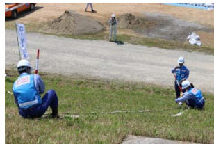
TEC-FORCEによる 被災状況調査訓練