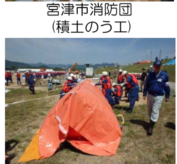
宮津市消防団 (積土のう工)