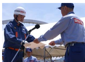
水防指揮官への感謝状授与