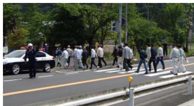
避難訓練会場での 住民避難、避難誘導訓練