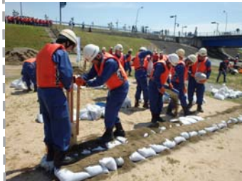
南丹市消防団 (積土のう工)