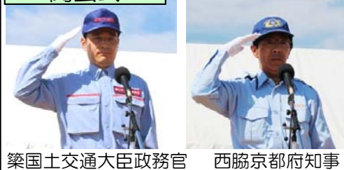
築国土交通大臣政務官 西脇京都府知事