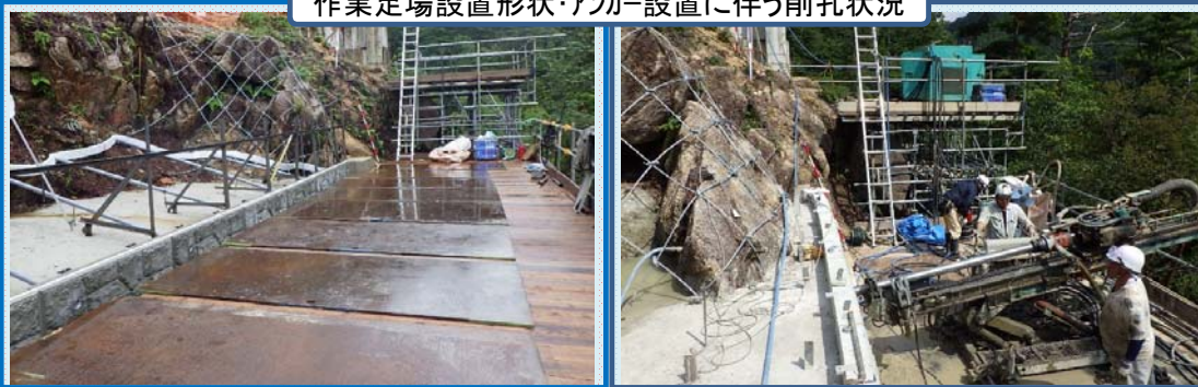
作業足場設置形状・アンカー設置に伴う削孔状況

工程のとおり作業が進み、この暑い時期を乗り越え、無事故で工期内の完成を目指します。