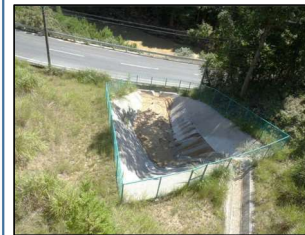
▲濁水処理設備（沈砂池）