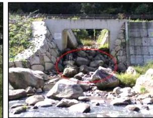
▲小動物の移動に対する配慮