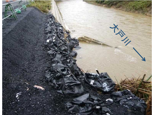
⑳河岸洗掘箇所(石居橋右岸上流側)