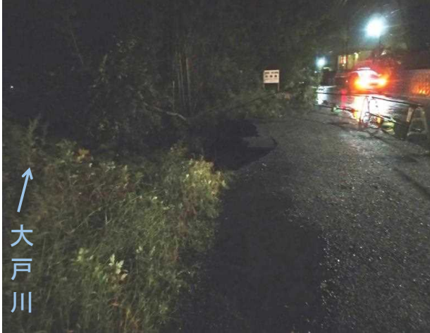
⑱河岸洗掘箇所(石居橋右岸上流側)