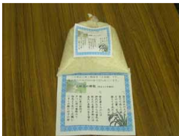
大戸川流域米どころの「日本晴」