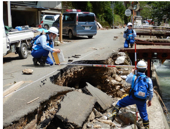
7/19 【道路班】被害状況調査(八代市)