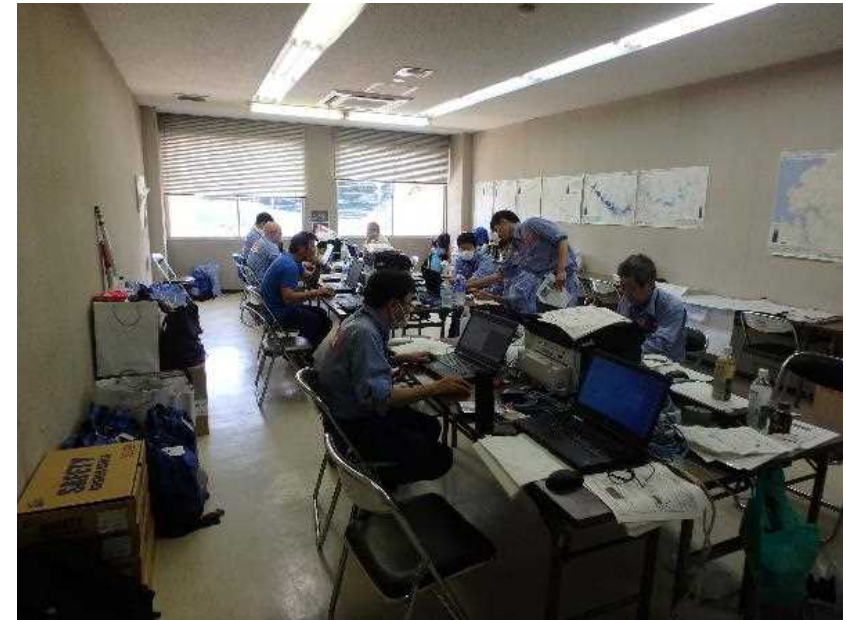
7/20 【河川班】現地調査のとりまとめ作業