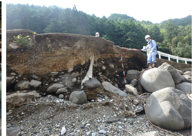
7/19 【道路班】被災状況調査(球磨村)