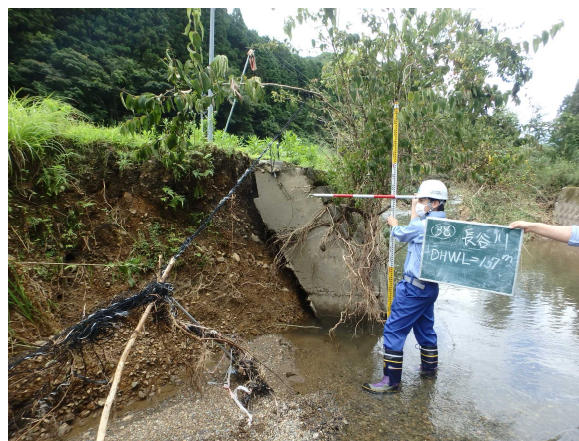
7/19 【河川班】被害状況調査(芦北町)