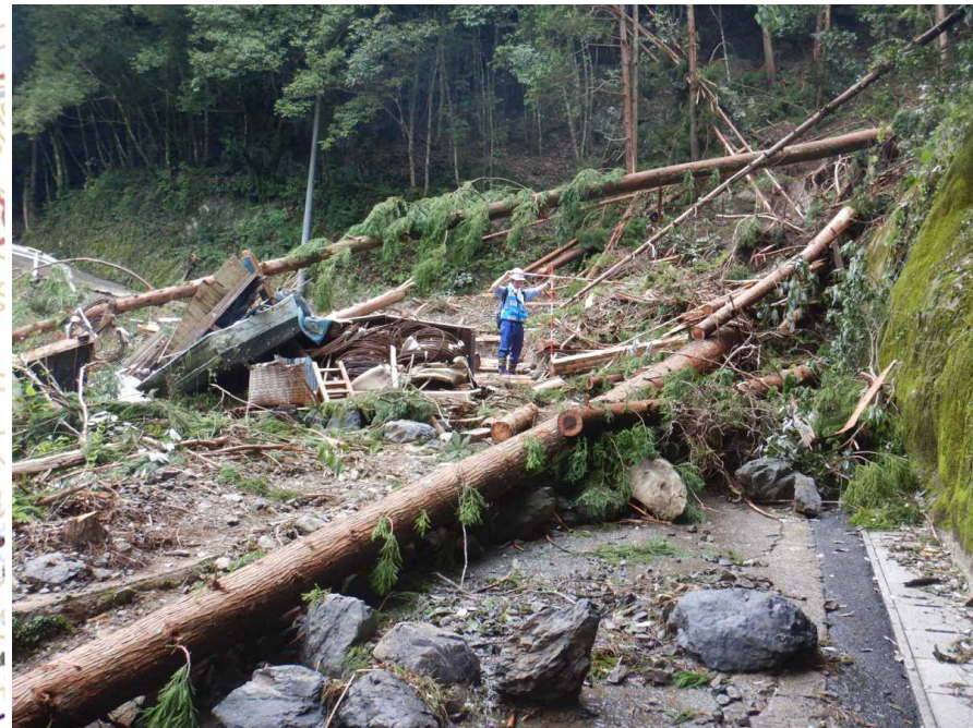
7/13 【道路班】被災状況調査 (芦北町)