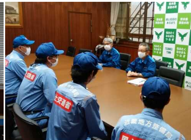
7/14 【河川班】津奈木町長へ手交