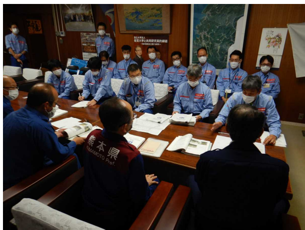
7/14 【河川班・道路班】被災状況説明(芦北町)