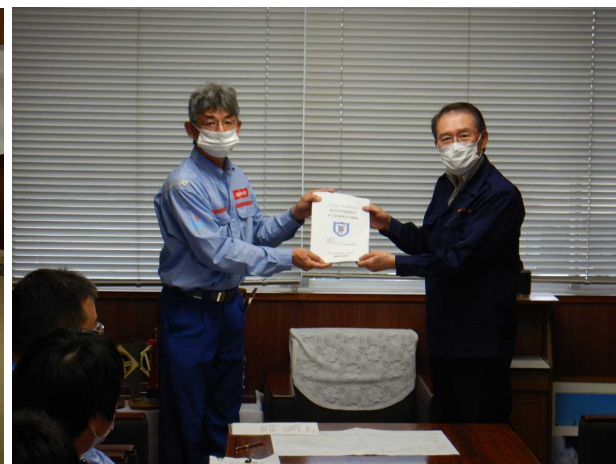
7/14 【河川班・道路班】芦北町長へ手交