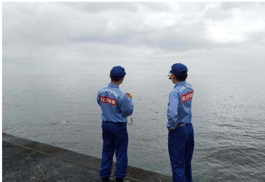
7/10 【港湾班】漂流物調査状況 (筑後川河口付近)