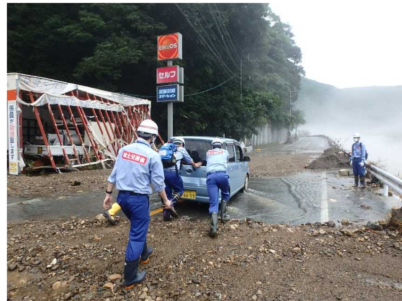
7/12 【道路班】被害状況調査 (八代市)