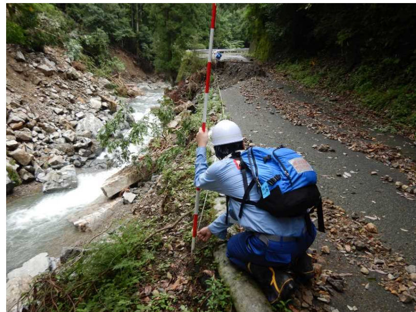
7/12 【道路班】被災状況調査 (芦北町)