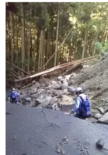
7/31【道路班】被害状況調査(八代市)