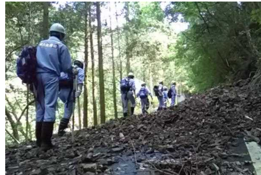
7/31【河川班】被害状況調査(八代市)