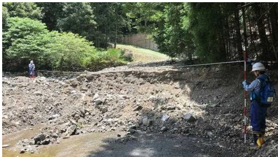
7/31【道路班】被害状況調査(八代市油谷ダム周辺)