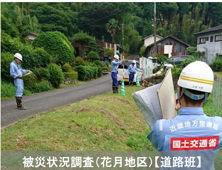
被災状況調査(花月地区)【道路班】