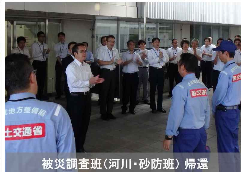
被災調査班(河川・砂防班) 帰還