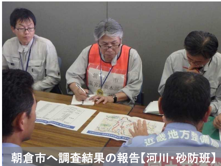
朝倉市へ調査結果の報告【河川・砂防班】