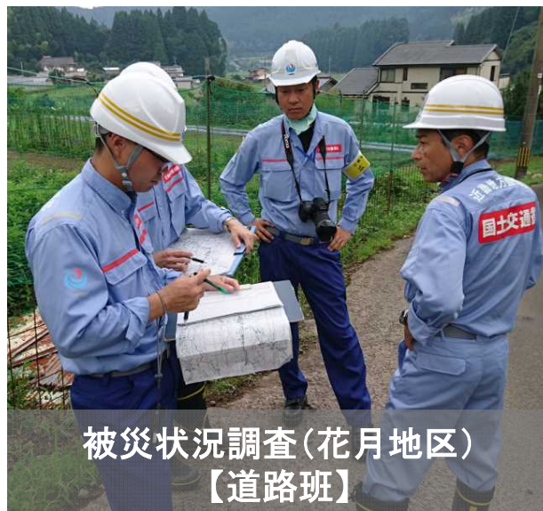
被災状況調査(花月地区) 【道路班】