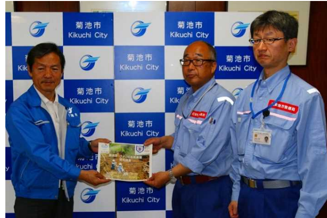
菊池市長へ調査結果説明・報告