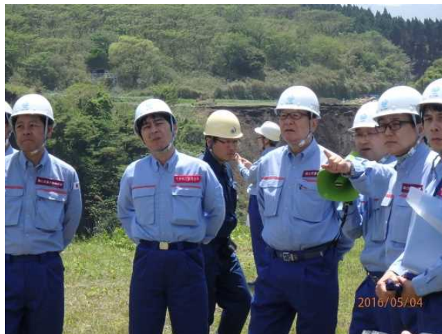
熊本県阿蘇郡南阿蘇村