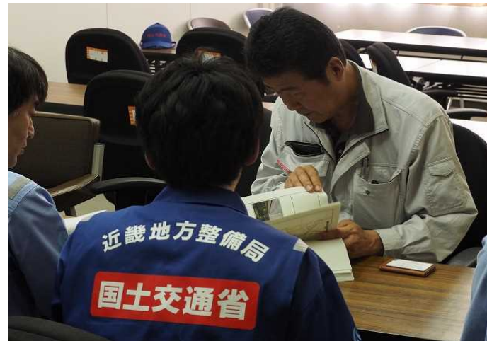
菊池市に報告書の説明・提出