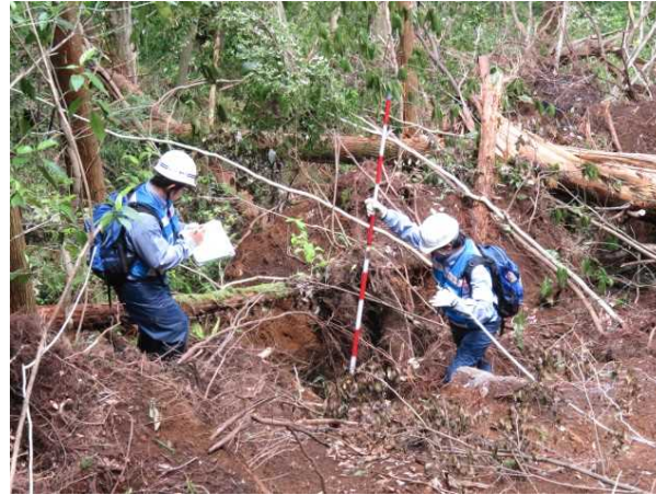
ナメリ川法面崩落箇所の現地調査状況(菊池市)