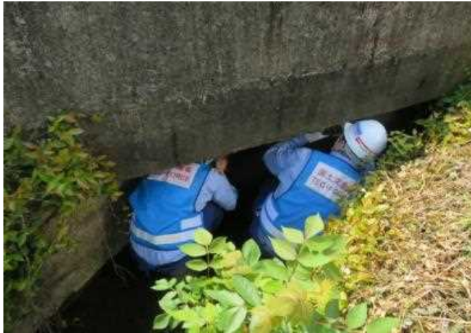
橋梁の現地調査状況(菊池市内)