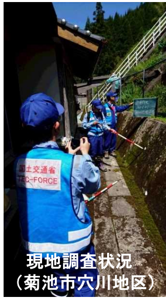
現地調査状況 (菊池市穴川地区)