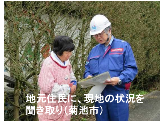
地元住民に、現地の状況を聞き取り(菊池市)