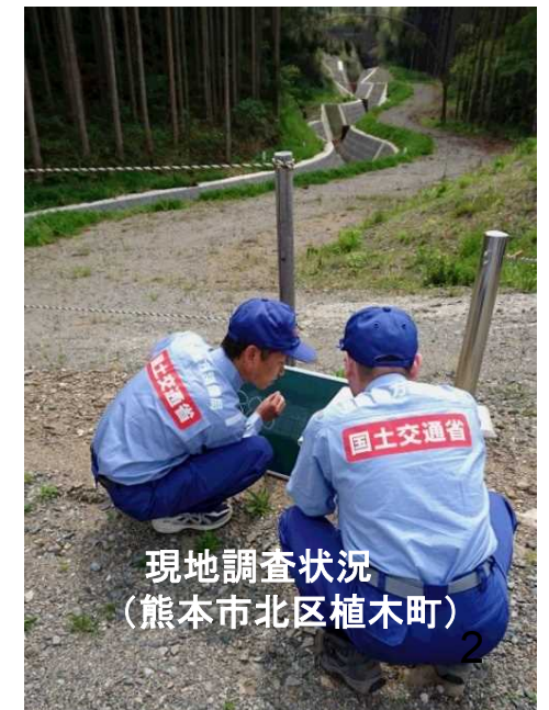
現地調査状況 (熊本市北区植木町)