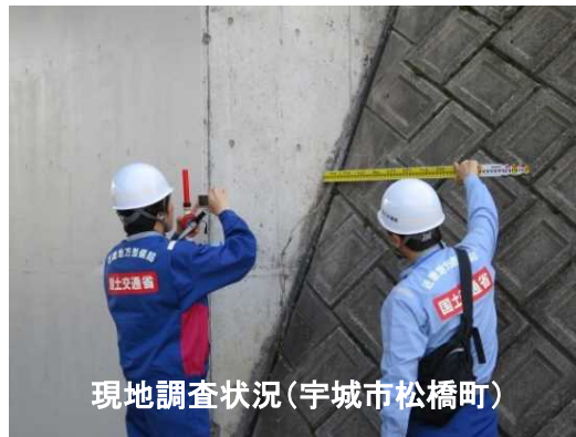
現地調査状況(宇城市松橋町)