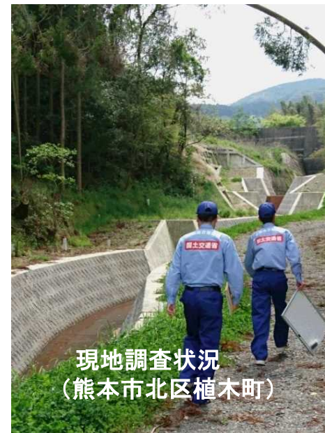
現地調査状況 (熊本市北区植木町)