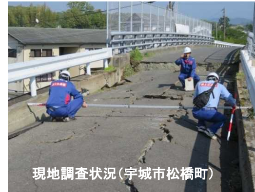
現地調査状況(宇城市松橋町)