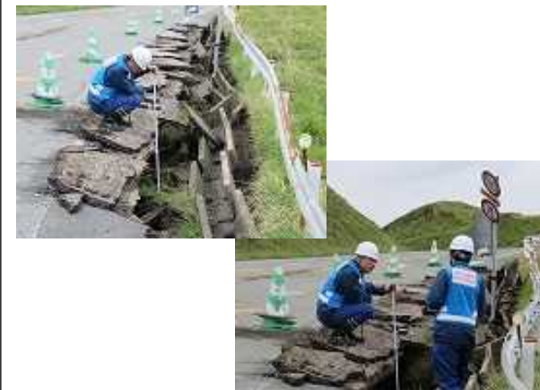
県道339号(ミルクロード)の被災箇所調査