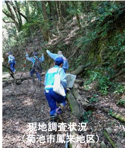
現地調査状況 (菊池市鳳来地区)