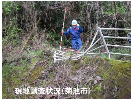
現地調査状況(菊池市)