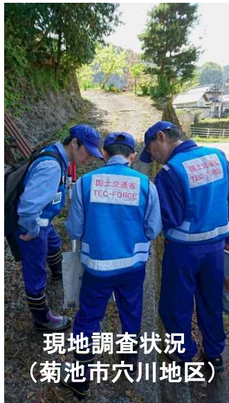
現地調査状況 (菊池市穴川地区)