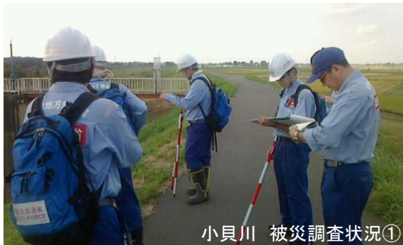
小貝川 被災調査状況①