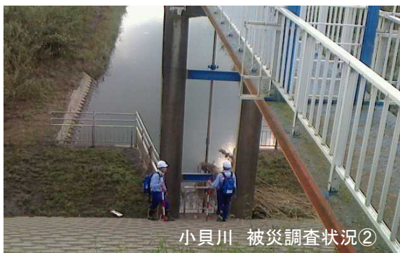
小貝川 被災調査状況②