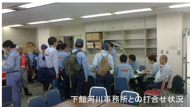
下館河川事務所との打合せ状況