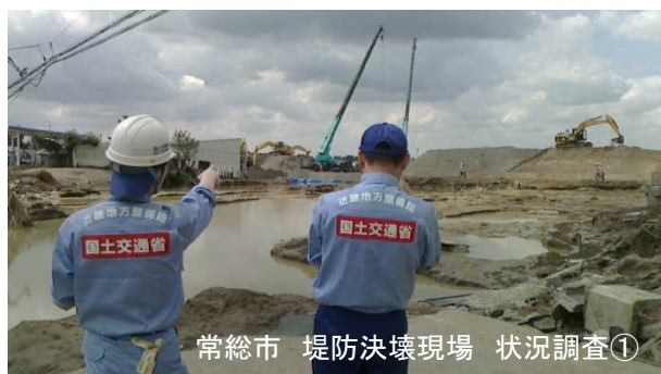
常総市 堤防決壊現場 状況調査①