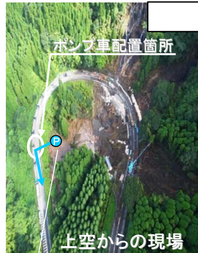
排水ポンプ車等作業状況