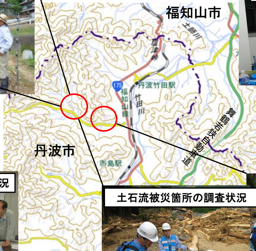
丹波土木事務所との打合せ状況