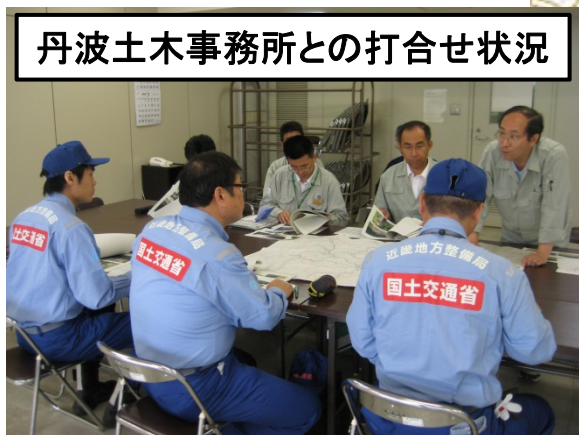
丹波土木事務所との打合せ状況