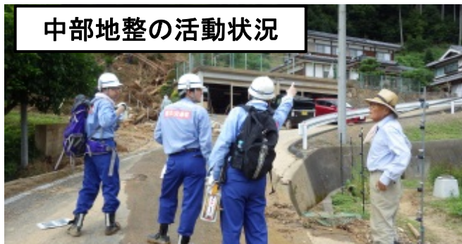
中部地整の活動状況