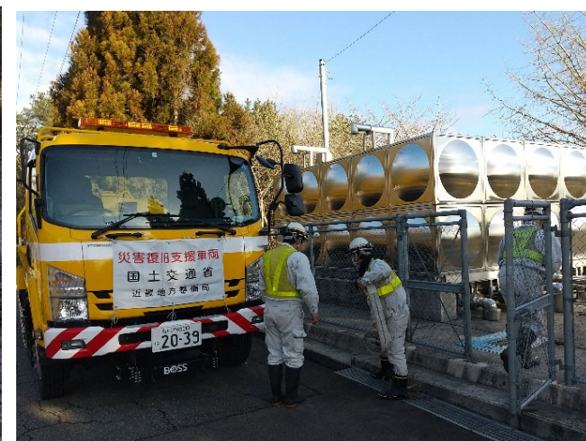
【給水班】能登町 給水状況（17日）