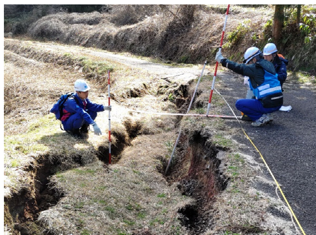
【道路班】輪島市 被災状況調査（17日）