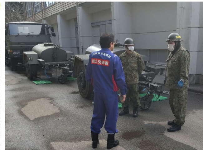
【水道班】穴水町 被災状況調査（17日）