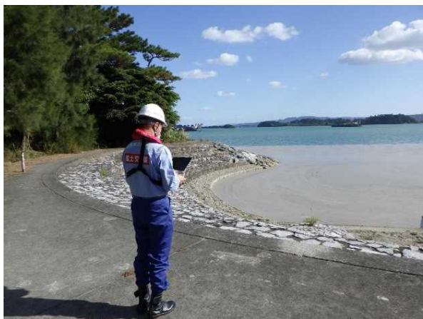
【羽地内海に漂着する軽石をドローンで撮影】