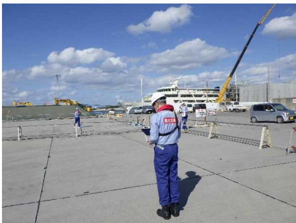
【本部港フェリーターミナルでのドローン撮影】