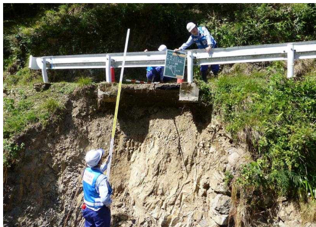
被災状況調査(道路)