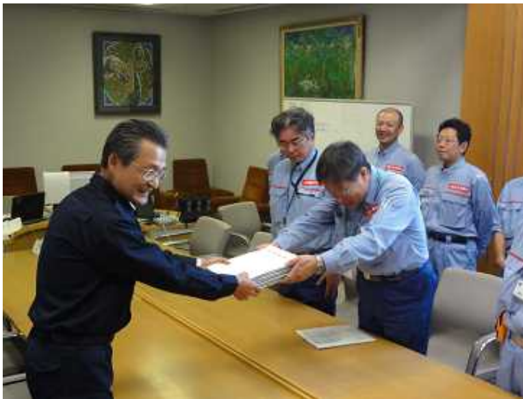
福井高島市長へ調査成果の引渡