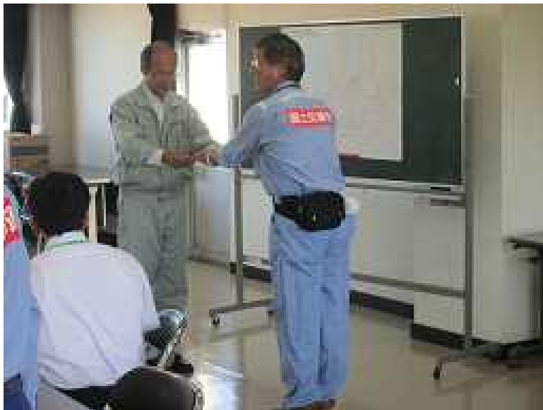
福井県敦賀土木事務所長へ調査成果の引渡

◇実施内容:被災状況調査をとりまとめ、調査成果報告書を福井県敦賀土木事務所長に提出