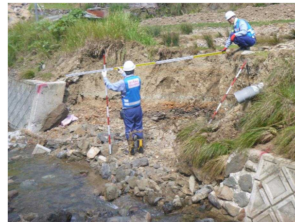
被災状況調査(河川)