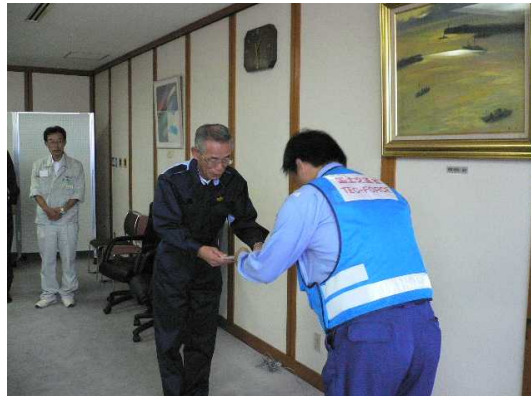
小浜市副市長へ調査成果の引渡

◇実施内容:被災状況調査をとりまとめ、調査成果報告書を小浜市副市長、 福井県小浜土木事務所長に提出