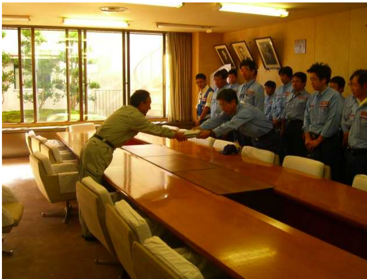
福知山市副市長へ調査成果の引渡