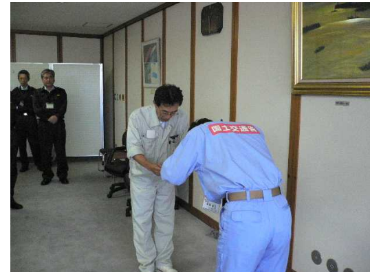
小浜土木事務所長へ調査成果の引渡