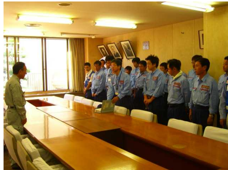
福知山市副市長へ調査成果報告