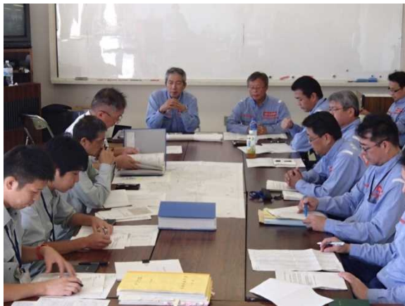
綾部市担当職員へ調査成果報告