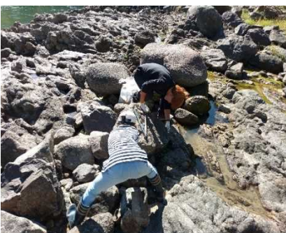
鳳凰湖船舶安全利用協議会からは約30名が参加