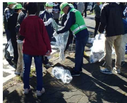
回収したゴミもみんなで分別