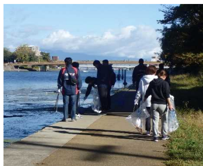
瀬田川ぐるりさんぽ道のゴミも回収しました