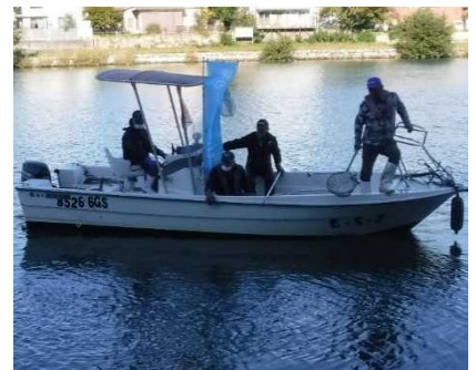
水面のゴミは船から回収しました