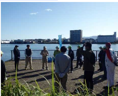
今から清掃活動を開始します