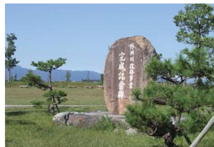
野洲川改修事業完成記念碑