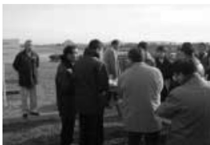
野洲川小浜河川公園