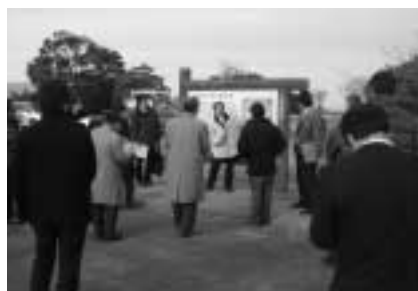
野洲川改修記念公園