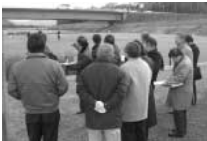
野洲川川田河川公園