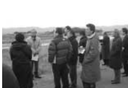
グライダー操縦訓練場(予定)