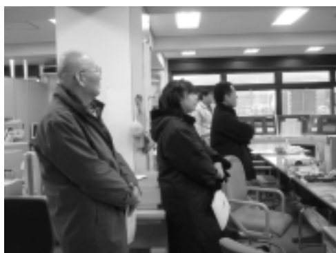
琵琶湖河川事務所では、瀬田川洗堰の操作説明を受けました。