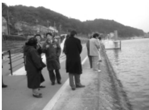
石山寺付近では、瀬田川散策路、周辺状況の確認を行いました。