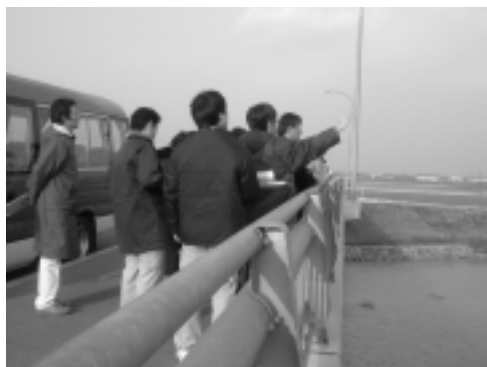
草津川では、ヨシの植生状況や護岸等の現況調査を行いました。