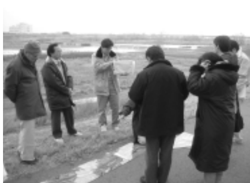
落差工左岸側では、落差工付近の高水敷の利用状況、河畔林の状況を調査しました。