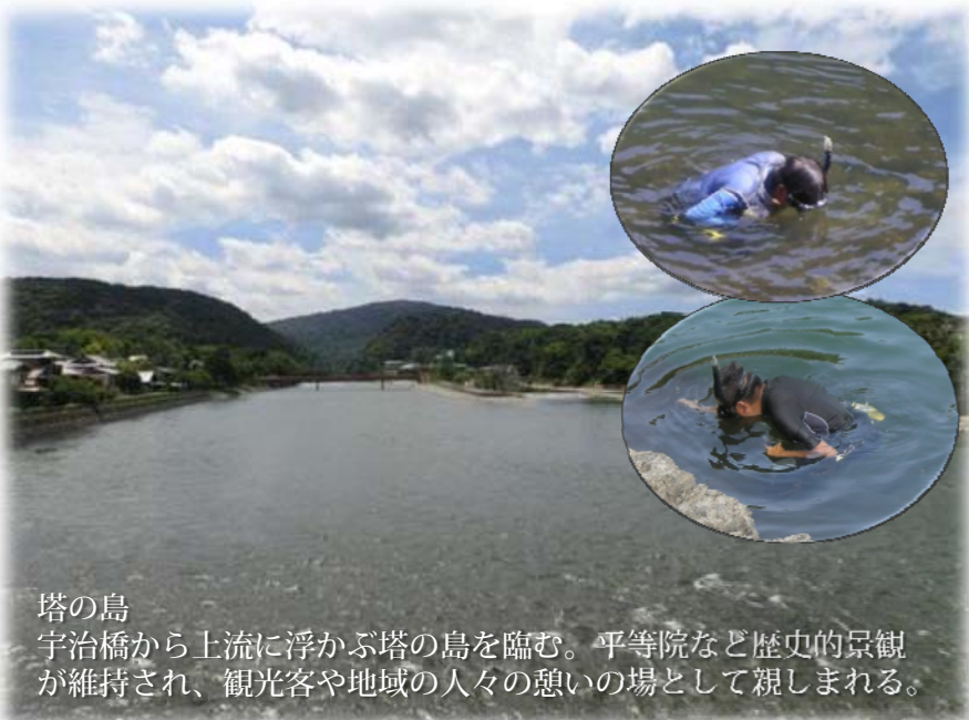
塔の島 宇治橋から上流に浮かぶ塔の島を臨む。平等院など歴史的景観が維持され、観光客や地域の人々の憩いの場として親しまれる。