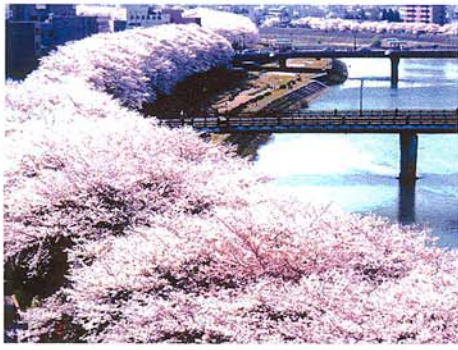
満開 (足羽川/桜橋~九十九橋を望む。)