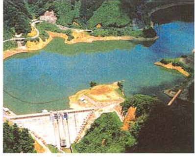
ダムの規模 堤高 63m 総貯水容量 11,300千m 3

広野ダムでは、渇水のときでも安定して取水ができるよう水を補給しますが、過去の大きな渇水であった平成六年や平成一二年にダムの水が枯渇し、特に平成六年には日野川から取水をしている農業や工業に深刻な影響を与えるといった状況になりました。