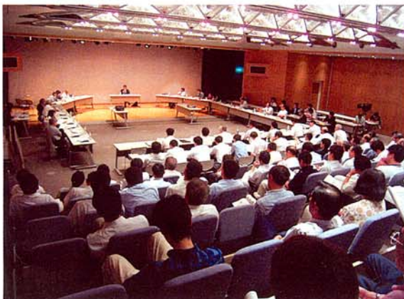
第22回流域委員会（平成16年7月10日）

また、インターネットの左記のホームページでもご覧になれます。 http://www.fukui-moc.go.jp/rvuki/index.html