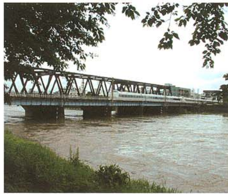
※桁下約2mまで水位が上昇しました。