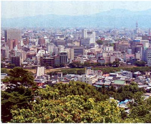
足羽山より福井市街地を望む（中央／足羽川）

京都福井市は、九頭竜川、日野川、足羽川に囲まれ、一〇年に一度の規模の洪水でも危険な状態となります。また、足羽川の桜並木は美しい景観ではありますが、張り巡らした根などにより、堤防を弱くしているという問題があります。また、脆い構造の特殊堤が続くなど、足羽川は治水に極めて心もとない状況となっています。これから現状を踏まえ、現在、九頭竜川流域委員会で足羽川などの治水、利水、環境について、当面二〇～三〇年に整備すべき内容の審議がされています。