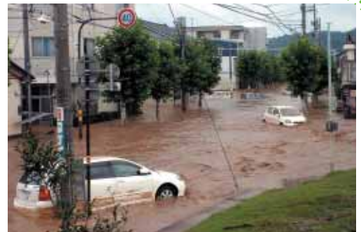
足羽川破堤地点の状況（H16.7.18）

また、近年では、昨年7月に都賀川（神戸市）や浅野川（金沢市）などで、局地的大雨により大きな被害が発生しています。