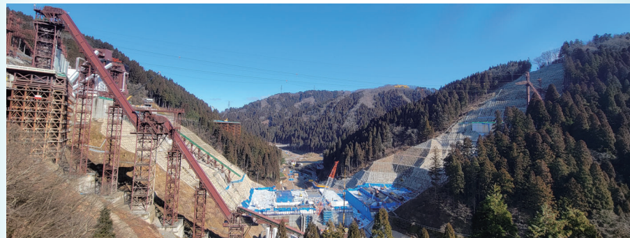
ダム本体工事 (令和6年2月時点)