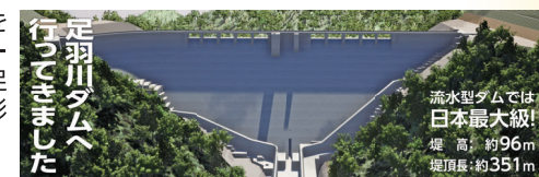
足羽川ダムへ行って来ました

足羽川ダム本体の完成イメージを7.1m×2.3mの迫力ある巨大スクリーンに再現しました。まだ見ぬ完成後の足羽川ダムと一緒に、一足早い記念撮影をどうぞ。