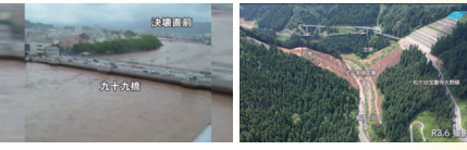
*展示内容は、今後の事業進捗に合わせて更新していきます

ダム建設ならではの大規模工事の様子や今では見ることのできない水没地域のかつての風景や暮らし、また未曾有の大災害となった福井豪雨の記録映像など、足羽川ダムのこれまでと今を学ぶことができます。