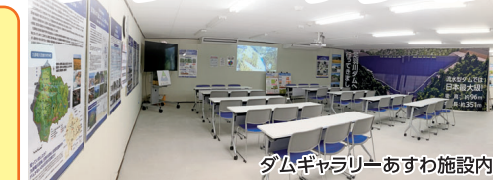
ダムギャラリーあすわ施設内