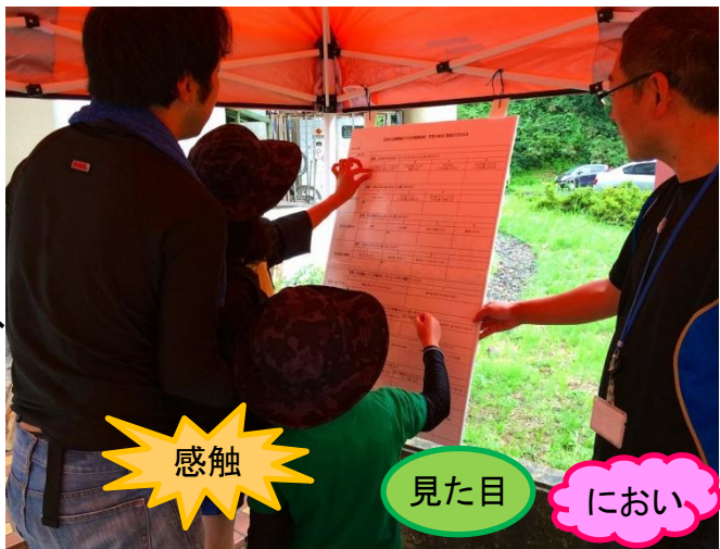
■水質の感覚指標調査

体験学習ではNPOが「水生生物調査」「アユ生態観察・つかみどり・試食」「フルーツ演奏体験」を、ダム事務所は「水質調査」(感覚指標調査、CODパックテスト)をそれぞれ分担して行い、親子が足羽川に直接触れ、水質の感覚指標調査への協力をいただくと共に、水質と生物との関係、ダム事業の概要についても知って頂くことが出来ました。