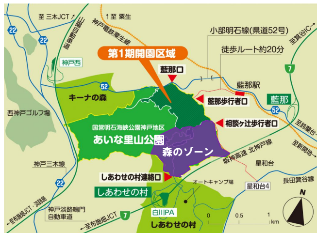
国営明石海峡公園神戸地区 位置図

国営明石海峡公園神戸地区（神戸市北区・西区、愛称：あいな里山公園）では、「森のゾーン」において官民連携事業の導入に向けた検討を進めています。このたび、民間事業者の皆様との対話を通じて事業のアイデアや参画条件などを把握するため、マーケットサウンディング調査を実施しました。