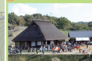
源義経の伝承が残る地「白拍子」。19世紀前期(江戸時代終り)に建てられた庄屋の茅葺き古民家です。