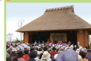
藍那集落にあった茅葺きの農村舞台を再現。伝統芸能をはじめさまざまなイベントを開催します。