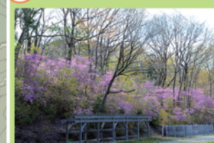
明るい里山林のもと、春には一面のコパノミツバツツジが彩る中をのんびり散策できます。