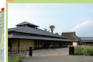
環境学習やセミナー、展示会などを行う「里山交流館」と、工作などを行う「木工棟」です。