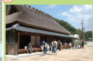
一谷の合戦にまつる伝承の地「相談ヶ辻」。明治時代初期以前に建てられた茅葺きの旅籠です。