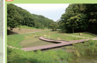
水辺の生きものが観察できる「めだか池」。すぐ南側には木見川が流れています。