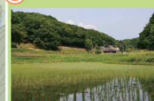
農作業や収穫などの体験プログラムを行う水田、畑、蓮田が広がる谷地です。