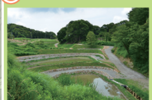
里山の棚田景観を保全・再生した棚田。湿地にはハイケボタルも生息しています。