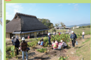
白拍子の家の裏側にある「だんだん畑」。季節ごとの耕作体験が楽しめます。