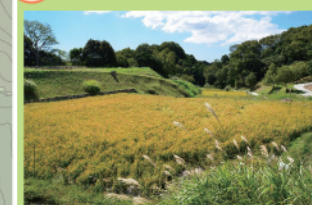
棚田ゾーンの中心にある白拍子棚田。昔からの地形を生かして水田耕作を行っています。