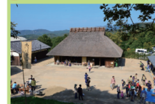
移築された茅葺き古民家「伝庫の家」。17世紀中期(江戸時代初期)に建てられた農家の家です。