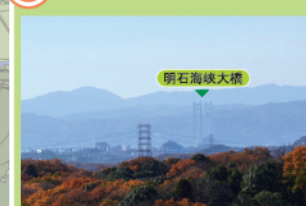
昔お盆の仏様を送って拝んだと言われる場所。雨天時には淡路島と明石海峡大橋が見渡せます。