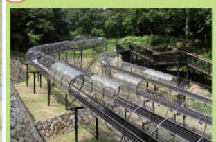
雑木林の中に作られた遊び場です。4つの大型すべり台などの遊具で楽しめます。