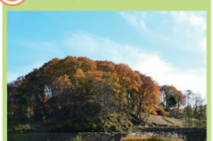
繁茂した竹や樹木を伐採し手入れした里山林。足元まで光が差し込む明るい落葉樹林です。