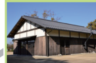
園内で見られる生きものの生体や標本、化石、きのこ、見ごろの植物情報などを展示しています。