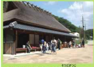
一谷の合戦にまつわる伝承の地「相談ヶ辻」。明治時代初期以前に建てられた茅葺きの旅籠です。