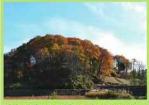
繁茂した竹や樹木を伐採し手入れした里山林。足元まで光が差し込む明るい落葉樹林です。