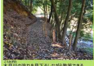
木見川の流れを見下ろしながら散策できる林間の小道。夏は涼しい木陰の道です。