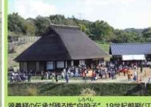
源義経の伝承が残る地「白拍子」。19世紀前期(江戸時代終り)に建てられた庄屋の茅葺き古民家です。