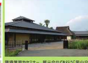
環境学習やセミナー、展示会などを行う「里山交流館」と、工作などを行う「木工棟」です。