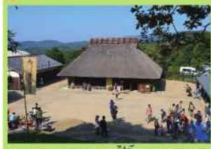
移築された茅葺き古民家「伝庫の家」。17世紀中期(江戸時代初期)に建てられた農家の家です。