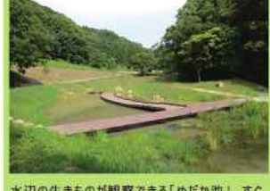
水辺の生きものが観察できる「めだか池」。すぐ南側には木見川が流れています。