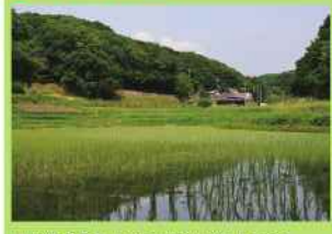
農作業や収穫などの体験プログラムを行う水田、畑、蓮田が広がる各水田です。