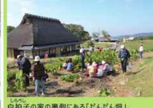
白拍子の家の裏側にある「だんだん畑」。季節ごとの耕作体験が楽しめます。