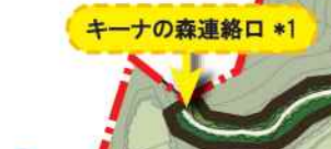
キーナの森連絡口 *1

*1 キーナの森連絡口の通行をご希望の方は通行前に管理センターへご連絡ください。(078-591-8000)