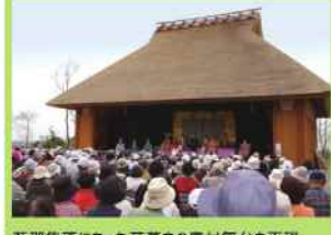
藍那集落にあった茅葺きの農村舞台を再現。伝統芸能をはじめさまざまなイベントを開催します。