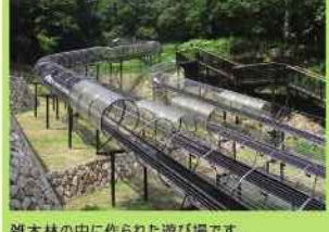
雑木林の中に作られた遊び場です。4つの大型すべり台などの遊具で楽しめます。