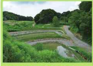
里山の棚田景観を保全・再生した棚田。湿地にはヘイケボタルも生息しています。