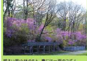
明るい里山林のもと、春には一面のコパノミツバツツジが彩る中をのんびり散策できます。