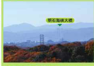
昔お盆の仏様を送って拜んだと言われる場所。晴天時には淡路島と明石海峡大橋が見渡せます。