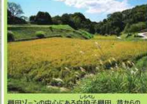
棚田ゾーンの中心にある白拍子棚田。昔からの地形を生かして水田耕作を行っています。