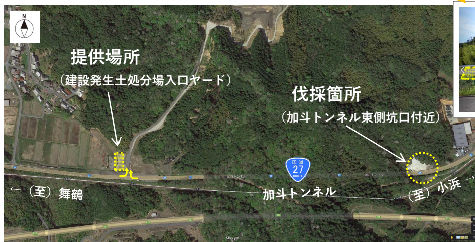
[入口扉とヤードの位置関係]