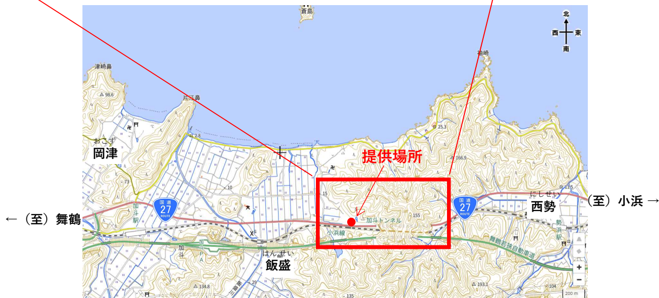
[電子地形図(国土地理院)を加工して作成]