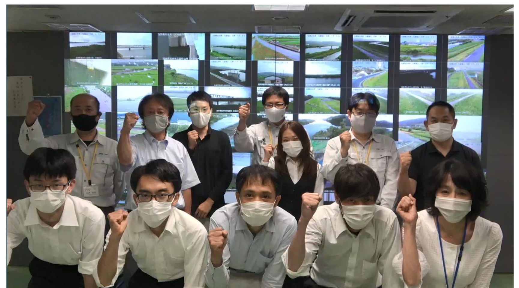
撮影時の様子（防災課紹介）