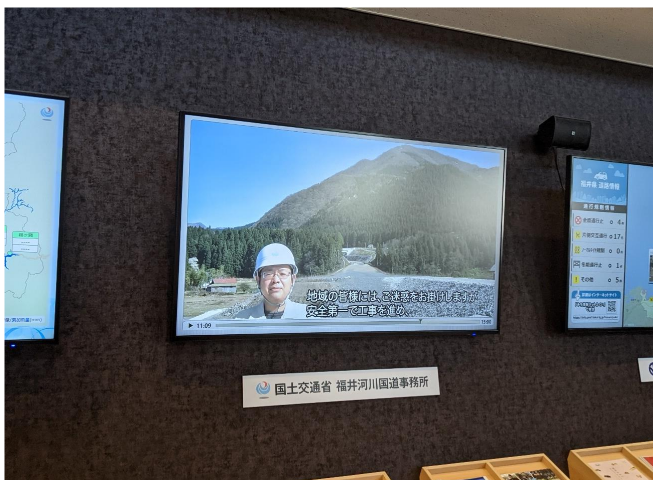
現地状況（映像配信用モニタ）