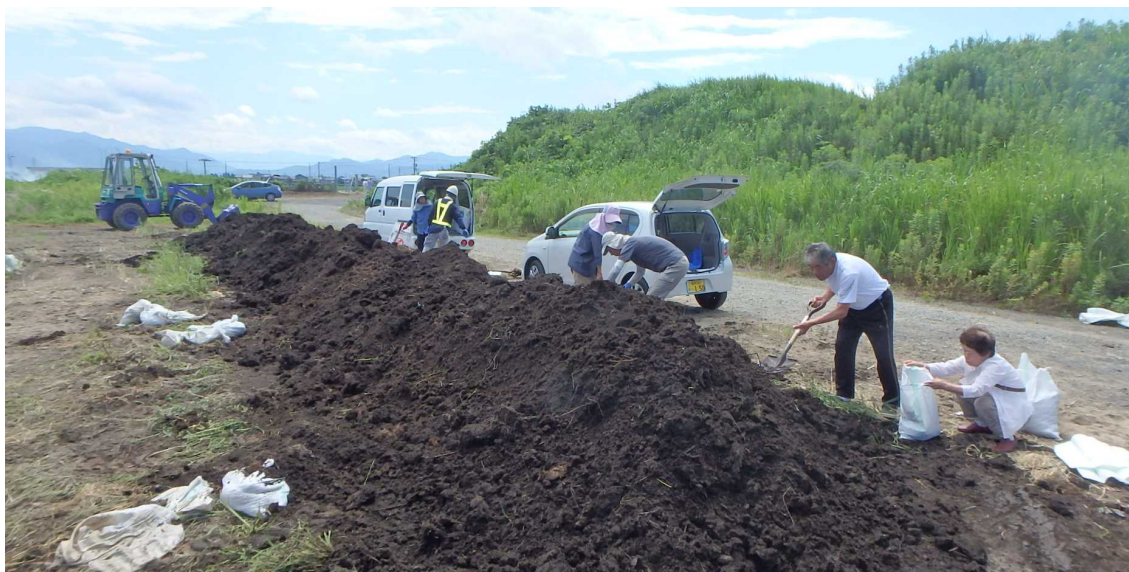
配布時の様子（令和元年7月）