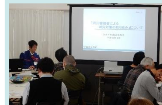
河川管理者による減災対策 の取り組みに関する説明