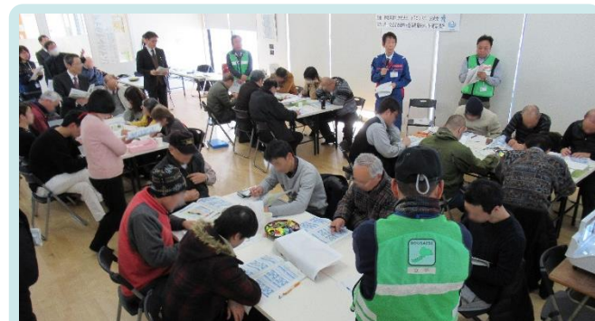
ワークショップ形式によるマイ・タイムラインの作成