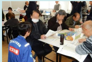
参加者へのアドバイス