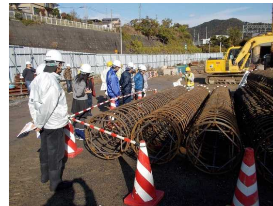
擁壁を支える杭に使う鉄筋についての説明をお聞きする皆さん