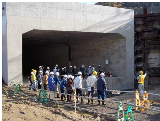
工事業者からJR北陸線をくぐるトンネルと前後の擁壁工事の概要をお聞きする皆さん