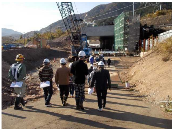
工事現場の敦賀市側に集合した後、滋賀県側に向かって現場に入っていく皆さん