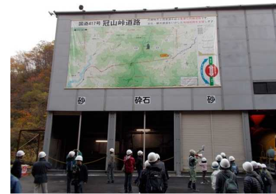
吹付プラントも見学して頂きました。