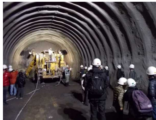
切羽部で、ドリルジャンボによる削孔状況を見つめる皆さん。