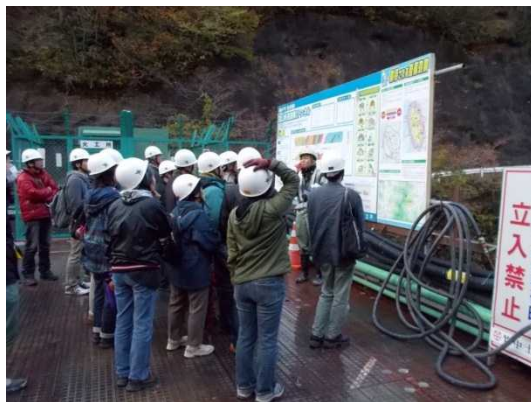
工事業者から冠山峠2号トンネル(仮称)工事の工事概要をお聞きする皆さん。