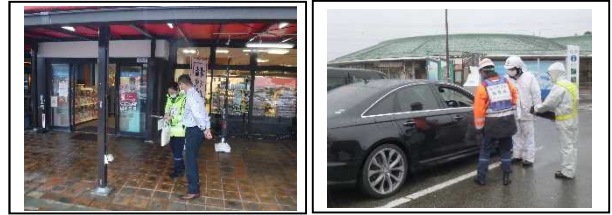
啓発状況写真(南条サービスエリア)