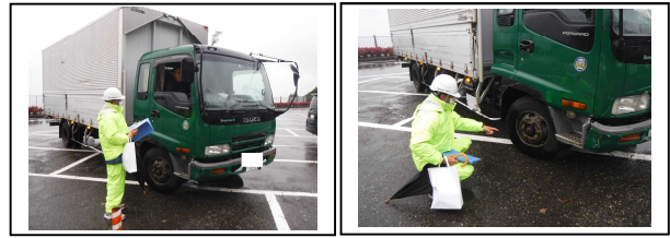
調査状況写真(道の駅「河野」)