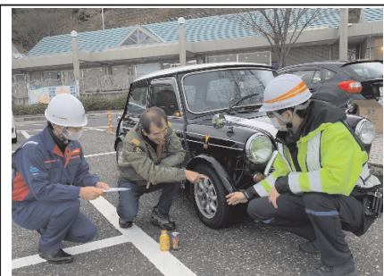
調査状況写真(調査箇所① 道の駅「河野」)