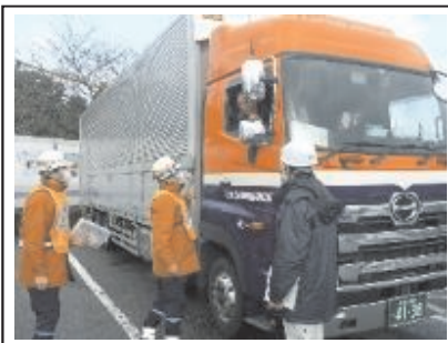
啓発状況写真(調査箇所② 道の駅「みくに」)