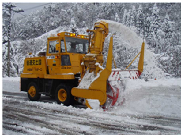
ロータリー除雪車