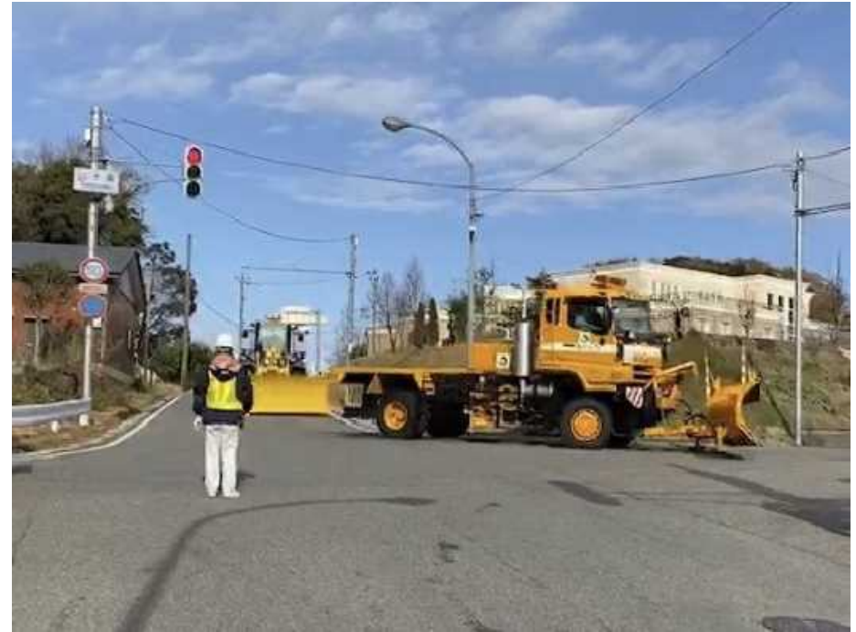
R1.11.29 雪害対応合同訓練状況（あわら市山十楽）