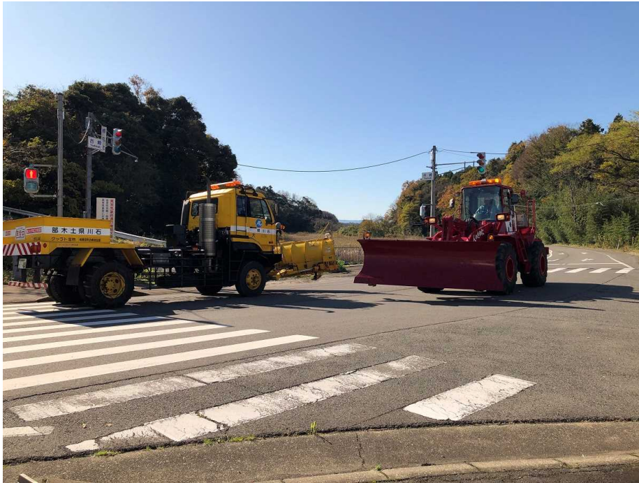
R1.11.29 雪害対応合同訓練状況（あわら市吉崎）