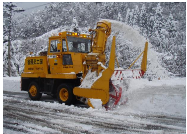
ロータリー除雪車